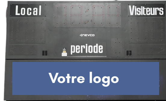
Tableau indicateur (2)